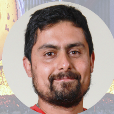
Fulvio Siciliano Dynamic Systems Inc./Gleeble