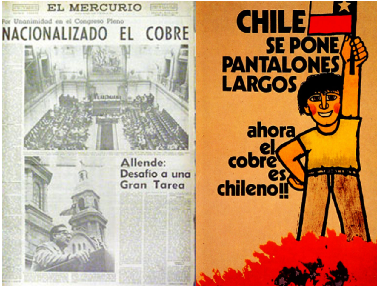
Figura N° 4. (a) Portada de “El Mercurio” el día 12 de julio de 1971, (b) Afiche “Chile se pone los pantalones largos, ¡¡ahora el cobre es chileno!!” (1971), hecho por Antonio Larrea y Vicente Larrea.

materializado en la nacionalización del cobre por Salvador Allende era uno en el que existía consenso en el país, pese a la polarización propia de la época. Los desafíos fueron tremendos para la clase trabajadora chilena, ya que en manos de los norteamericanos se encontraban los puestos de jefatura y la tecnología, sin ir más lejos incluso los manuales de las máquinas se encontraban en inglés. En ese contexto los mineros e ingenieros chilenos debieron demostrar su capacidad para manejar la industria del cobre. Sin ir más lejos, a un año de la nacionalización se pasó de una producción de 8.000 toneladas de cobre mensual a 16.000 toneladas, alcanzando metas crecientes de producción que llegaron a 19.000 toneladas en abril y mayo de 1973 en El Teniente. Recomendamos ver el episodio de los 50 años de la