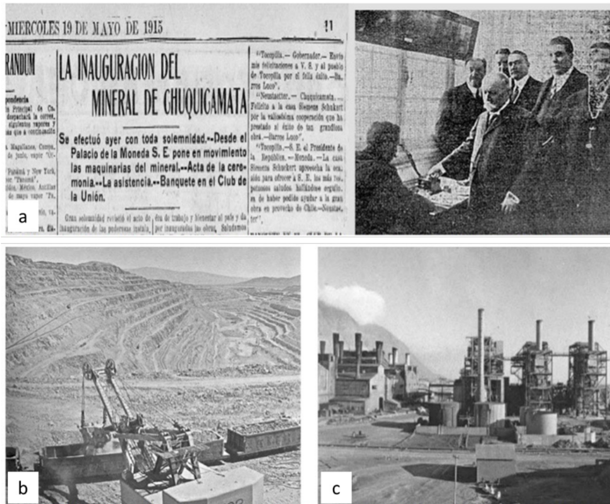
Figura N° 3. a. Portada del mercurio 19 de mayo; b. la mina de Chuquicamata y c. Termoelectrica de Tocopilla todas de 1915.

a los mínimos impuestos que pagaban las compañías norteamericanas y la soberanía que tenían, causó un desplazamiento político que demandaba subir los impuestos, la nacionalización y estatización de los yacimientos, estas exigencias fueron incrementando sostenidamente construyendo el Departamento del Cobre en 1955, el cual poseía atribuciones de fiscalización y de colaboración en el mercado mundial del Cobre (Biblioteca Nacional de Chile, 2023d).