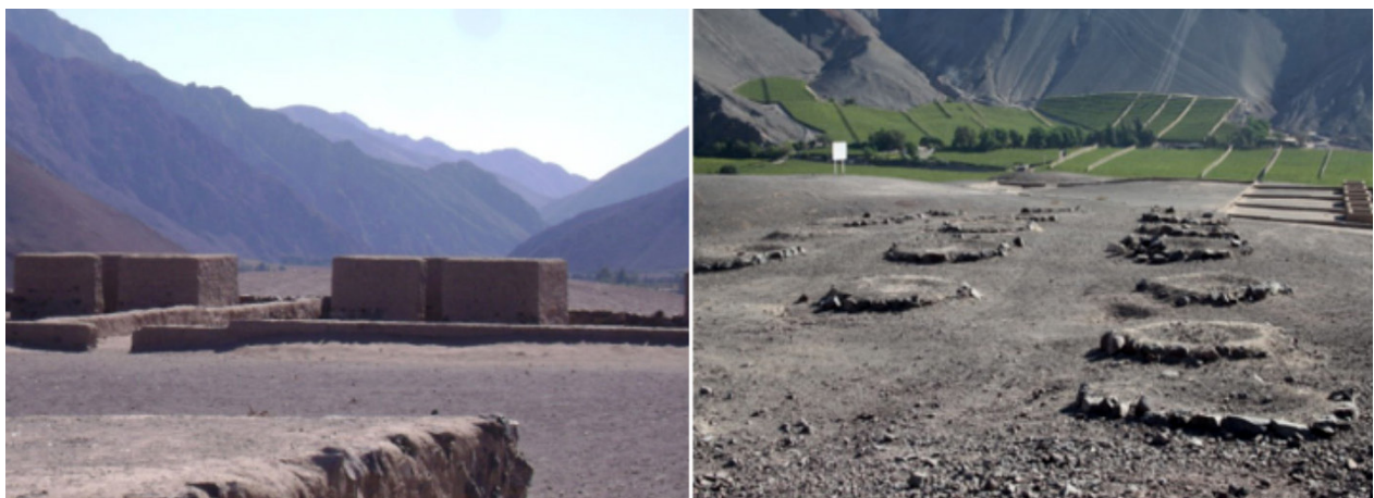
Figura N° 1. Sitio arqueológico Viña del Cerro, manifestación de la influencia del legado inca en la cultura diaguita, vestigios de centro de fundición con hornos Huayras.

Por otro lado, aparte de los nuevos conocimientos sobre metalurgia extractiva concedidos por el pueblo Inca a los habitantes del norte de Chile, también existen hallazgos de que se practicaron técnicas avanzadas como lo es la fundición de metales de plata, cobre y posteriormente aleaciones de bronce, esto gracias a hornos caseros de arquitectura rectangular Inca, llamados Huayras (o huayrachinas cuya traducción literal desde el quechua es viento), que se caracterizaban por tener forma de chimenea en donde se introducía la roca de mineral en bruto junto con carbón, la mayor cualidad de estos hornos es que tenían agujeros de ventilación que permitían la inyección de oxígeno para ayudar a la combustión, como resultado de este proceso la roca se fundía y se vaciaba en un molde final. En el interior del valle de Copiapó, en Viña del Cerro se encontraron 26 hornos Huayras, este fue uno de los principales y más importantes centros de fundición en el país y estuvo en funcionamiento entre aproximadamente